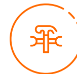
Rakentamisen ja talotekniikan kauppa